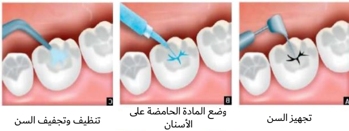
تنظيف وتجفيف السن