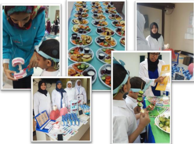
World Health Week Activities