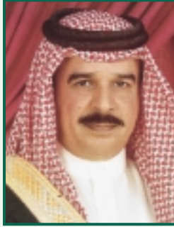
بعضة مائة من حرس الجلالة الملك حمد بن عيسى آل خليفة تملكت من كاتبة البحث بيننا والقرى