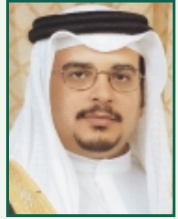
عبدالله بن حمد آل خليفة وفي القصر الملكي في الرياض