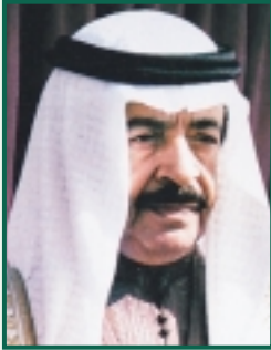
عبدالله بن حمد آل خليفة نخبة الوزراء والمؤسسين